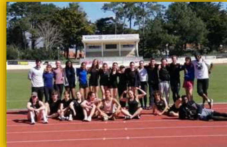
Le collectif de jeune en stage aux Sables-d'Olonne en avril 2023