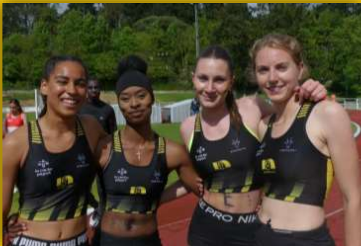
Le relais 4x400m féminin aux Interclubs