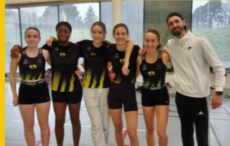
Une partie du groupe sprint