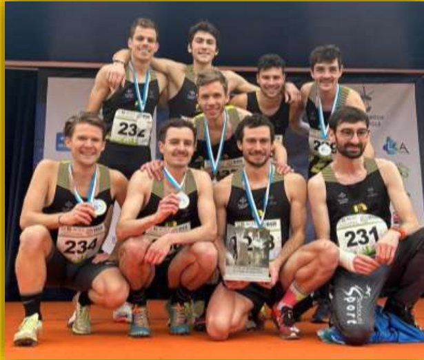
L'équipe championne inter-régionale de cross-court et qualifiée au championnat de France